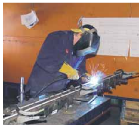
Högtryck i Lepros mekaniska verkstad. Företaget erbjuder även pulverlackeringsanläggning för externa kunder.

Företaget har funnits i femton år och har sedan Kalervo tog över företaget för tio år sedan fördubblat omsättningen. Lepro i Hofors AB märker inte av lågkonjunkturen och har inte varslat någon av de 14 anställda.