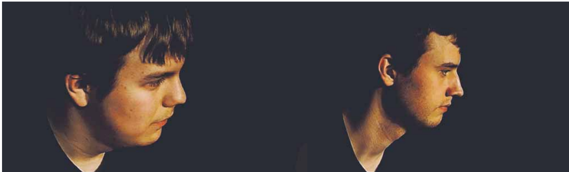
Hofors barn och ungdomar får i Hofors Kulturskola det stöd de behöver för att utveckla sina talanger inom dans, teater och musik.

*Vann gjorde Luleå kommun. Delad tvåa var Solna kommun.