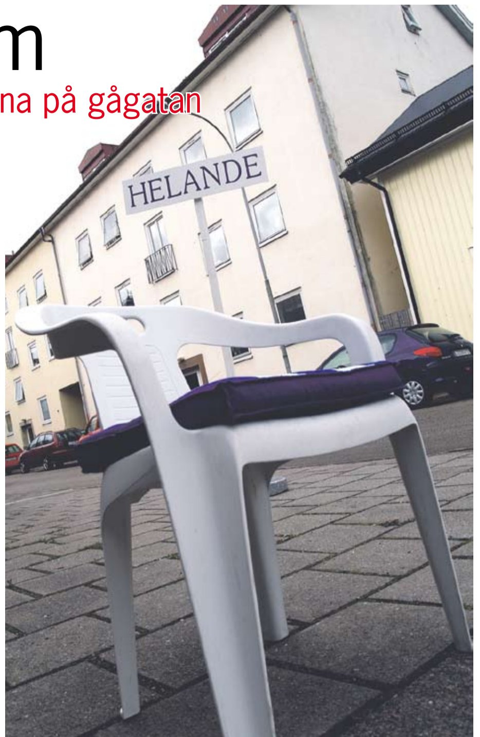
Stolen i centrum. Pingstkyrkan erbjuder förbön i Vänersborgs stadskärna till alla som önskar varannan torsdag förmiddag hela hösten.

"I vårt sekulariserade samhälle finns en enorm andlig törst, det visar också de positiva reaktioner vi fått, framför allt från personer som normalt inte besöker någon kyrka."