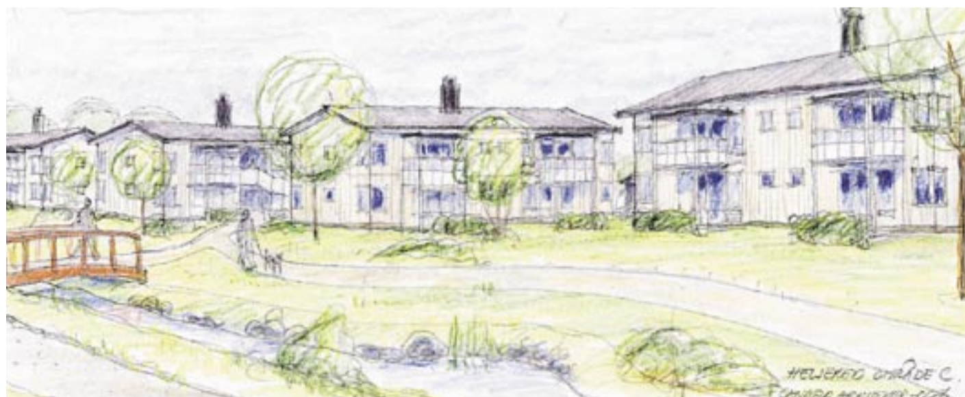
Om några år kommer Ekebo att vara helt etablerad – ett modernt bostadsområde med parkstråk och natursköna omgivningar. Arkitekt: Ingmar Mattson, Candela Arkitekter.

Intresserade av kooperativ hyresrätt i Ekebo kan gå in på www.ekebo.com eller kontakta MölnaldsBostäder för att göra en intresseanmälan för att få en inbjudan till det informationsmöte som kommer att hållas i slutet av oktober. På detta möte kommer experter från Kooperativ Konsult att närvara för att svara på frågor och en interimsstyrelse att bildas bland de närvarande för att ta fram styrelsens stadgar. Föreningen kommer i framtiden att besluta om vilka som får bli medlemmar och hyresgäster. Initialt fungerar MölnaldsBostäders hyrespolicy som vägledande där gamla hyresgäster till MölnaldsBostäder och anknytning till Mölnadal/Källered ges företräde. Innan jul ska denna medlemsprocess vara klar med inflyttning i de nya hyresrätterna mellan 1 april och 1 juli 2006.