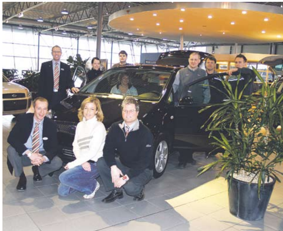
Välkommen till Bilia Ford i Eklanda! Bilanläggningen som alltid eftersträvar Helt nöjda kunder.

Bilia Ford finns på fem orter i Göteborgsregionen: Eklanda/Mölndal, Hisingen, Kungälv, Alingsås och Kungsbacka och har totalt 110 medarbetare.