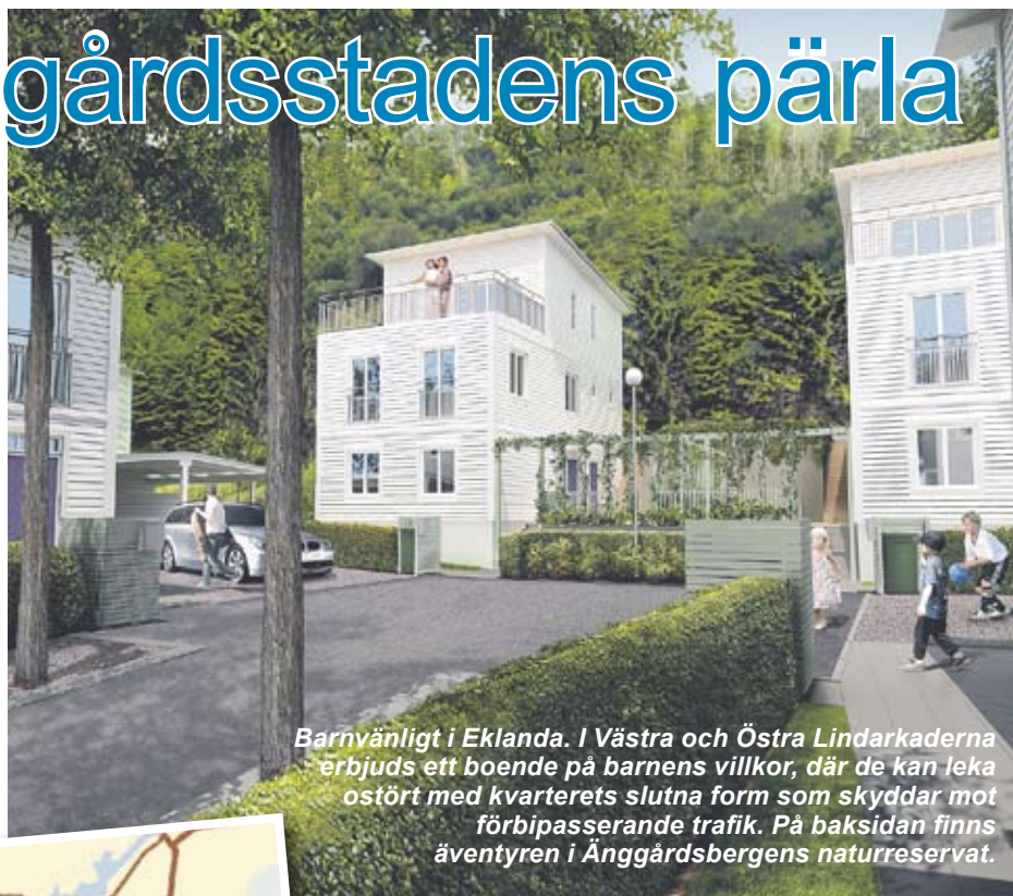
Barnvänligt i Eklanda. I Västra och Östra Lindarkaderna erbjuds ett boende på barnens villkor, där de kan leka ostört med kvarterets slutna form som skyddar mot förbipasserande trafik. På baksidan finns äventyren i Änggårdsbergens naturreservat.

Såväl Terrassvillan som Parkvillan har uteförråd, carport samt extra parkeringsplats. Skanska Nya Hem erbjuder även alternativa planlösningar och inredningsval som exempelvis braskamin eller bastu.