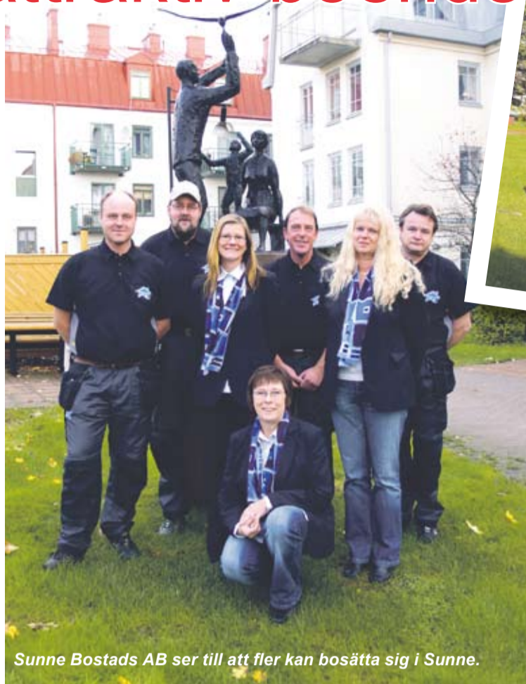
Sunne Bostads AB ser till att fler kan bosätta sig i Sunne.

För att ytterligare förbättra rörligheten på bostadsmarknaden i Sunne planerar Sunne Bo-