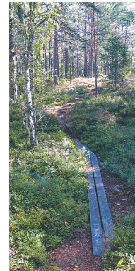
Ny mark, nya stigar. Tierps kommun är en av de första kommunerna i Sverige med att låta medborgarnytta genomsyra hela organisationen. Tierp ger sig ut på framtidens stigar för framtidens behov.

– Vi kan omöjligen idag se exakt hur det kommer att se ut, men vad vi vet är att vi inför framtiden kommer att ha en helt annan uppställning att hantera medborgarnas behov än vad vi har idag. Vi ska även vara måna om att skapa incitament i arbetsuppgifterna så att förbättringsarbeten och effektiviseringar stimuleras positivt.