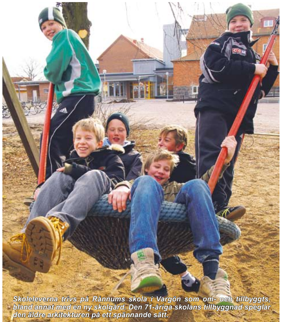
Skoleleverna trivs på Rånnums skola i Vargön som om- och tillbyggs, bland annat med en ny skolgård. Den 71-åriga skolans tillbyggnad speglar den äldre arkitekturen på ett spännande sätt.

Rånnums skola har ca 190 elever i förskoleklass till klass 6, en klass i varje årskurs. I skolan finns även tre fritidshem integrerade.