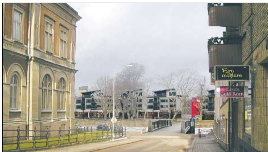
I Sundsgatans förlängning planeras det för en ny gång- och cykelbro över Gamla hamnkanalen, där även nya bryggor för småbåtar planeras.

Sanden och Lilla Vassbotten är en oslipad diamant mitt i Vänersborg. Med fler bostäder och broförbindelser samt utökad handel kommer Vänersborg att kunna attrahera fler att handla och röra sig i stadskärnan.