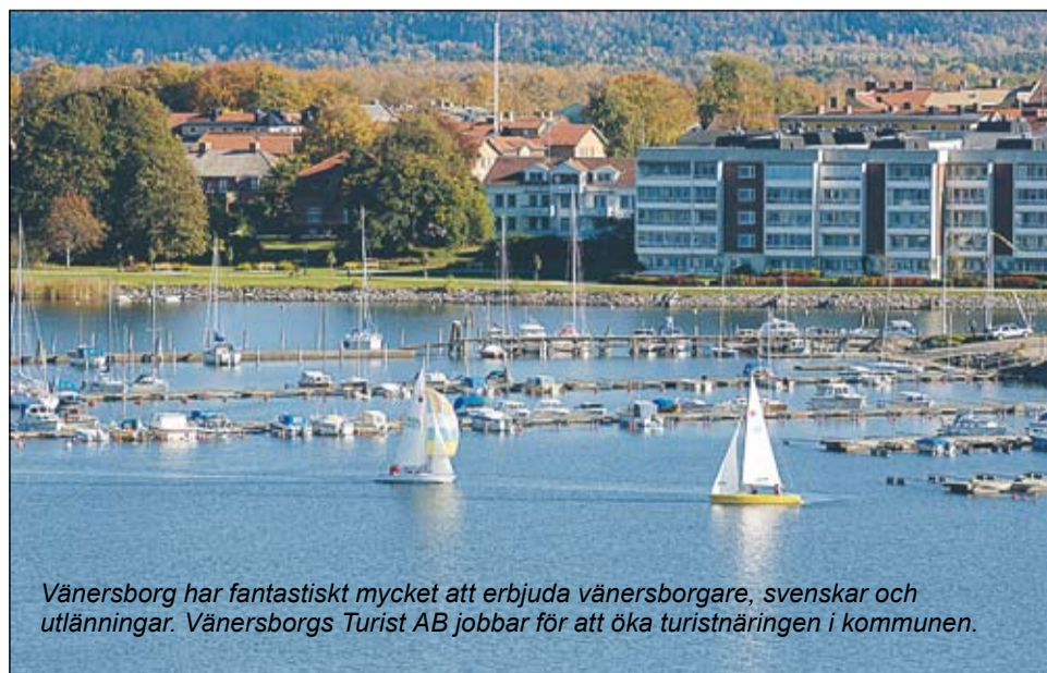
Vänern har fantastiskt mycket att erbjuda vänernborgare, svenskar och utlänningar. Vänerns Turist AB jobbar för att öka turistnäringen i kommunen.